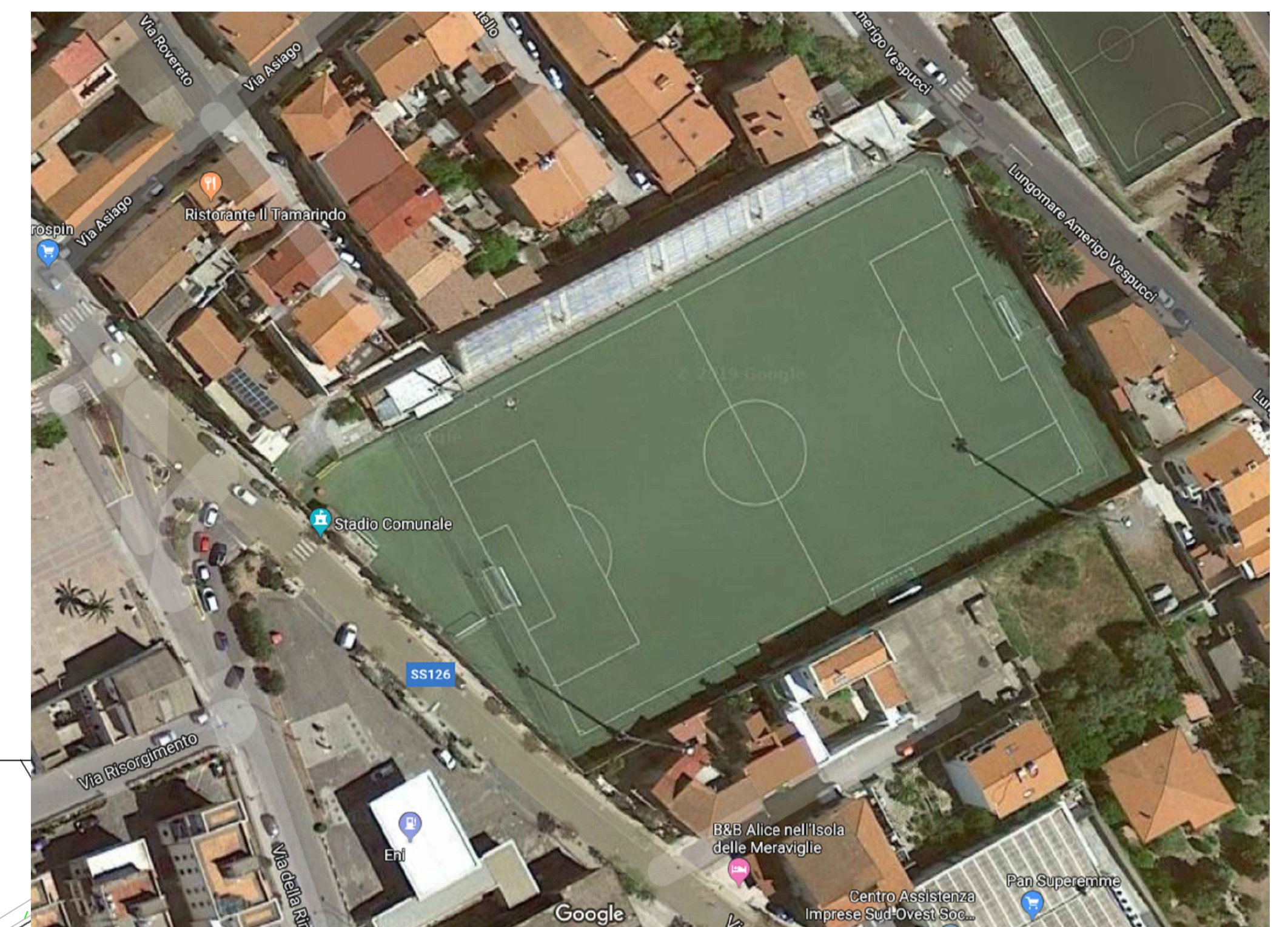
STRALCIO FOTO AEREA