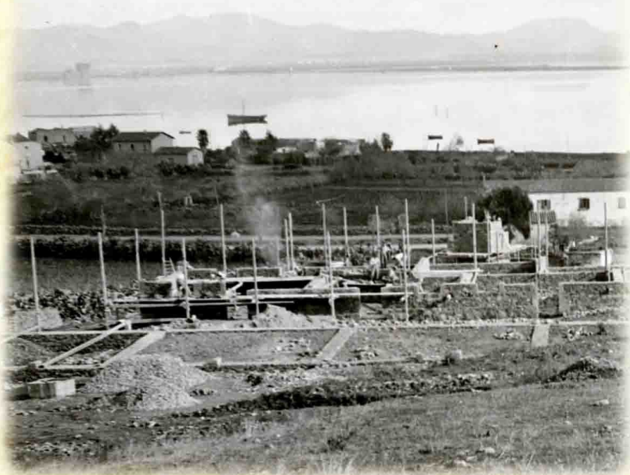
1940 - Panorama da Monte Cresia durante la costruzione delle case popolari. Dalla Stazione cominciavano i campi e dietro il fumo sa Gruxi de is Reliquias.

2009 - PROGETTO A CURA DI COOP. STUDIO FT. S. ANTIOCO - ALLESTIMENTO E STAMPA. AGIS CAD (egit_cad@hotmail.it)